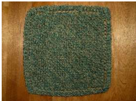
linge de table

Pour faire ce linge de table, nous tricotons simplement des mailles à l'endroit. Ce qui n'empêche pas de se pratiquer à faire des points de fantaisie. En exécutant des augmentations et des diminutions de mailles, nous donnons l'illusion d'un travail en biais. Nous pouvons également faire une modification pour changer le projet en serviette pour la porte du four.