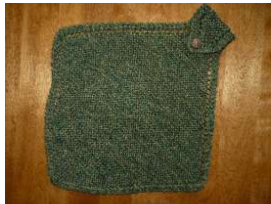
serviette pour la porte du four