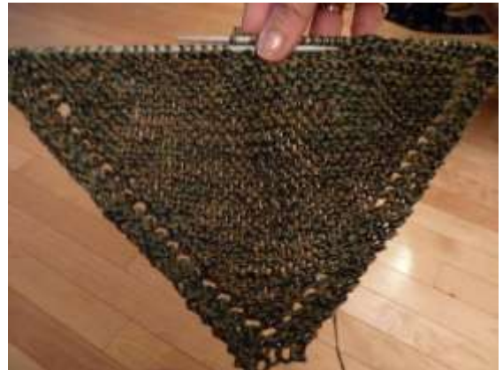
milieu du travail

En tricotant un jeté, ça fait une maille de plus et un trou comme décoration.